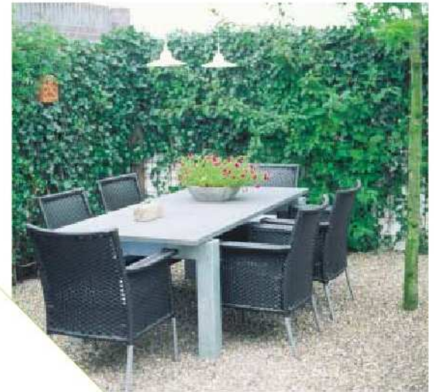
> Op het achterterras wordt met de familie gegeten en gedronken. Daar komt de avondzon. Als deze achter de kim verdwijnt kan de familie door de verlichting boven de hardstenen tafel tot laat in de avond natafelen. <