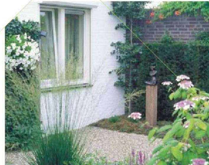
> Van Mierlo heeft de kleine patioïnen een groen karakter gegeven door zowel verticaal als horizontaal de ruimte optimaal te begroenen. Hedera begroeit voor driekwart de witte wanden, kleine bomen als Crataegus persimilis 'Splendens' zorgen voor de hoogtewerking, en achter een smalle taxushaag klimt Hydrangea anomala subsp. petiolaris tegen de wand. Hydrangea aspera , vaste planten als Hosta 'Halcyon', de bodembedekker Acaena en het gras Stipa zorgen voor een gevarieerde beplanting. <