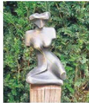
> Een zittend naakt staat voor een geschoren taxushaag en trekt vanuit de woonkamer direct de aandacht. <