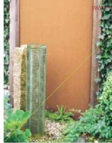
> Het waterornament van granietbanden en glas is door Rien van Mierlo zelf ontworpen. Het staat voor een Cortenstalen plaat ingeladerd door klimopplanten. Vanuit de slaapkamer wordt het oog via het plantvak geleid naar het waterelement. <