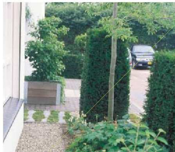
> De verspringende taxushagen zorgen voor beslotenheid maar zonder dat een opgesloten gevoel ontstaat. <