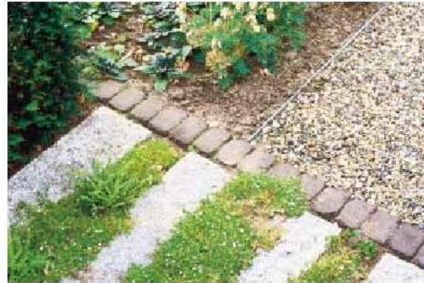
> Zowel in de voor- als achtertuin heeft de hovenier granietbanden als verharding gebruikt, die worden afgewisseld met Sagina subulata . Ook deze keuze draagt bij aan de groene uitstraling van de tuin. <