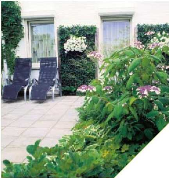
> Het terras bij de woonkamer is bedoeld als rustplek voor de bewoners. In de twee luie stoelen lezen de bewoners geregeld een boek. <