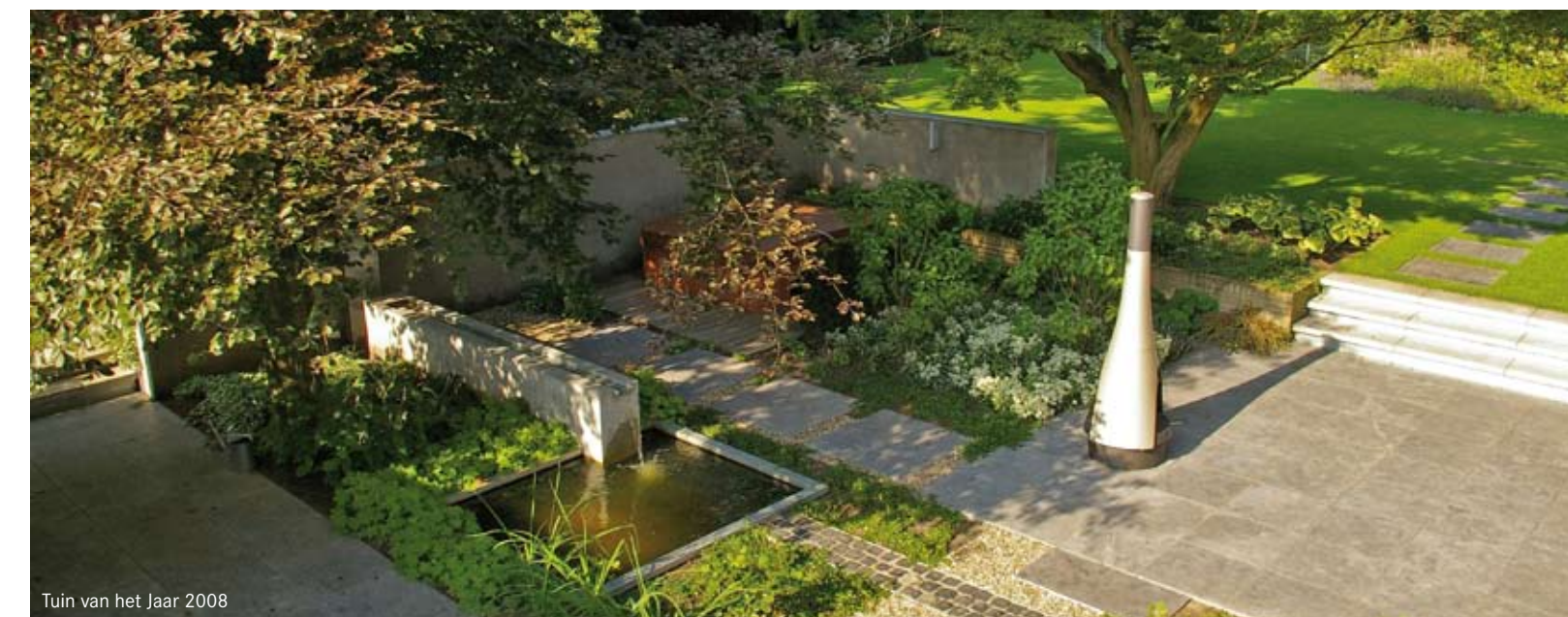
Tuin van het Jaar 2008

Helmondseweg 111 5751 PH Deurne Tel: 0493-314593 info@rienvanmierlotuinen.nl www.rienvanmierlotuinen.nl