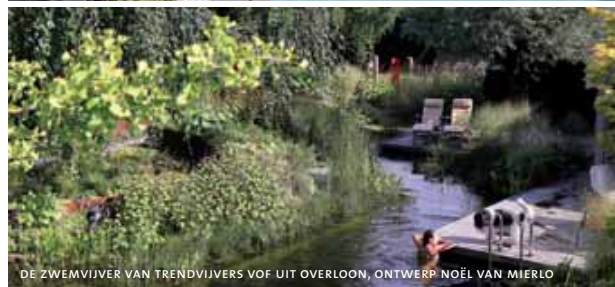
DE ZWEMVIJVER VAN TRENDVIJVERS VOF UIT OVERLOON, ONTWERP NOËL VAN MIERLO

Over het natuurzwembad dat Koninklijke Ginkel Groep aanlegde, was de jury ook zeer lovend: 'Het natuurzwembad is mooi ingepast in de tuin. De directe omgeving van het bad staat geheel in het teken van zwemmen met mooie zitranden en intieme plekken. Een fijne plek in de tuin om je terug te trekken en te ontspannen. Er is veel duurzame techniek toegepast die mooi is weggewerkt.'