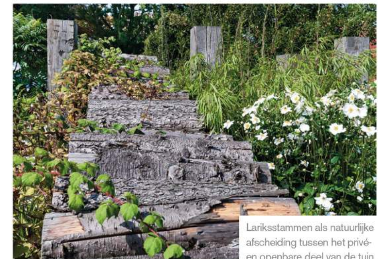
Lariksstammen als natuurlijke afscheiding tussen het privé- en openbare deel van de tuin.