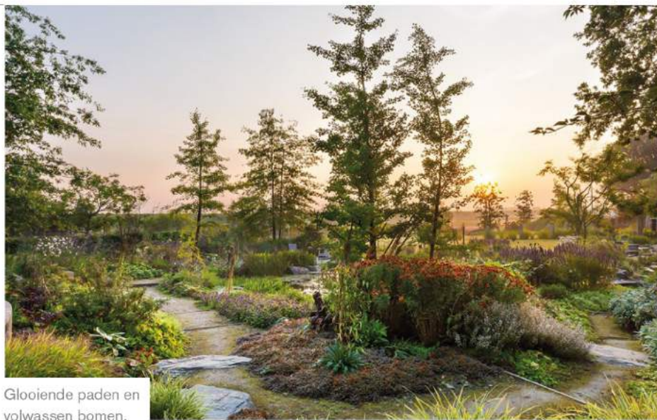
Glooiende paden en volwassen bomen.

'DE EIGENAARS HOUDEN VAN ECHTE NATUUR EN AVONTUURLIJKE LANDSCHAPPEN. DAT ZIE JE TERUG IN DE TUIN'