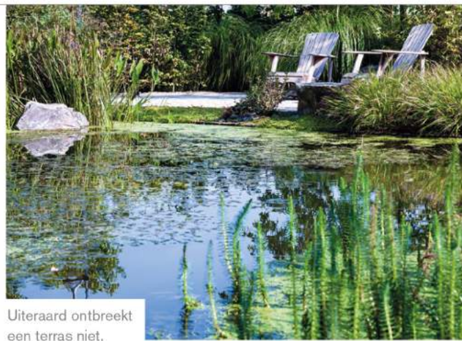
Uiteraard ontbreekt een terras niet.

loopvlonder, met planken uit een oude scheepsvloer. De ideale tuinbeleving is volgens Van Mierlo naar de tuin kunnen kijken én er onderdeel van zijn. "Je hebt zowel plekken met uitzicht nodig als bijvoorbeeld een olifantenpad van stapstenen tussen de beplanting, waar je even één kunt worden met de planten."