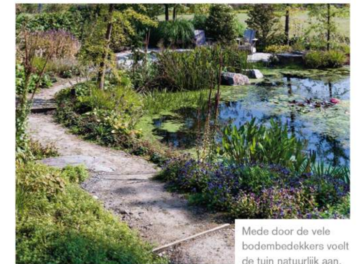
Mede door de vele bodembedekkers voelt de tuin natuurlijk aan.

Om de grens tussen het privé- en openbare deel van de tuin te markeren, gebruikte Van Mierlo een rij oude meerpalen. "Behalve dat die passen bij de jachthaven, hebben ze een verweerde look die bijdraagt aan het natuurlijke karakter van de tuin. En, ook heel belangrijk, ze fungeren als rustpunten voor het oog. Dat heeft elke tuin nodig: objecten die de blik vasthouden." Om die reden verwerkte hij in het tuinontwerp ook een houten brug en ▶